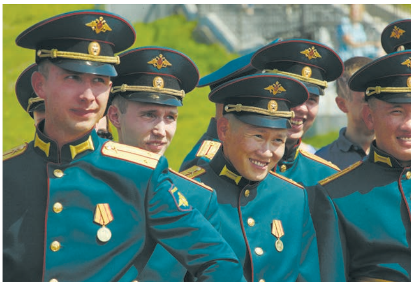
Рис. 1. Выпускники подразделения военной подготовки при Сибирском федеральном университете

В настоящее время такая подготовка реализуется в интересах 16 органов военного управления при 34 образовательных организациях, в которых проходят обучение более 10 тыс. студентов. Она рассматривается Минобороны России в качестве дополнительного источника комплектования войск (сил) офицерами и осуществляется как малозатратная форма подготовки офицеров с максимальным задействованием потенциала гражданской высшей школы. Подготовка проводится по 90 наиболее востребованным в Вооруженных Силах наукоемким и высокотехнологичным военно-учетным