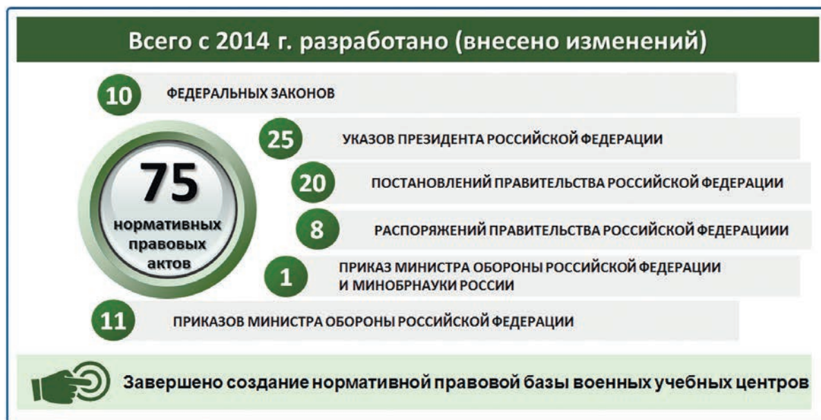
Рис. 6. Итоги разработки нормативных правовых актов

готовки Главным управлением кадров Министерства обороны Российской Федерации, отвечающим за организацию военной подготовки в образовательных организациях, совместно с заинтересованными органами военного управления проводилась большая работа по нормативному правовому обеспечению изменений. Так, за последние семь лет разработаны с нуля либо