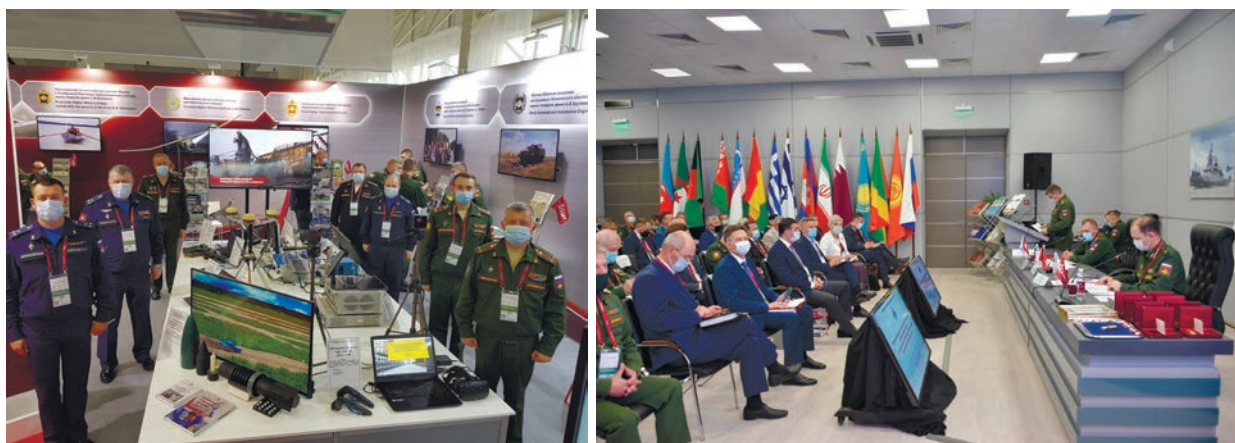
Рис. 7. Выставочная экспозиция и круглый стол «Подготовка военных кадров в военных учебных центрах» на Международном военно-техническом форуме «АРМИЯ-2020»

Совершенствование нормативной базы непрерывно продолжается. Так, с 1 января 2021 г. вступила в силу законодательно закреплённая возможность военнослужащему — преподавателю военного учебного центра, срок военной службы которого в присвоенном воинском звании