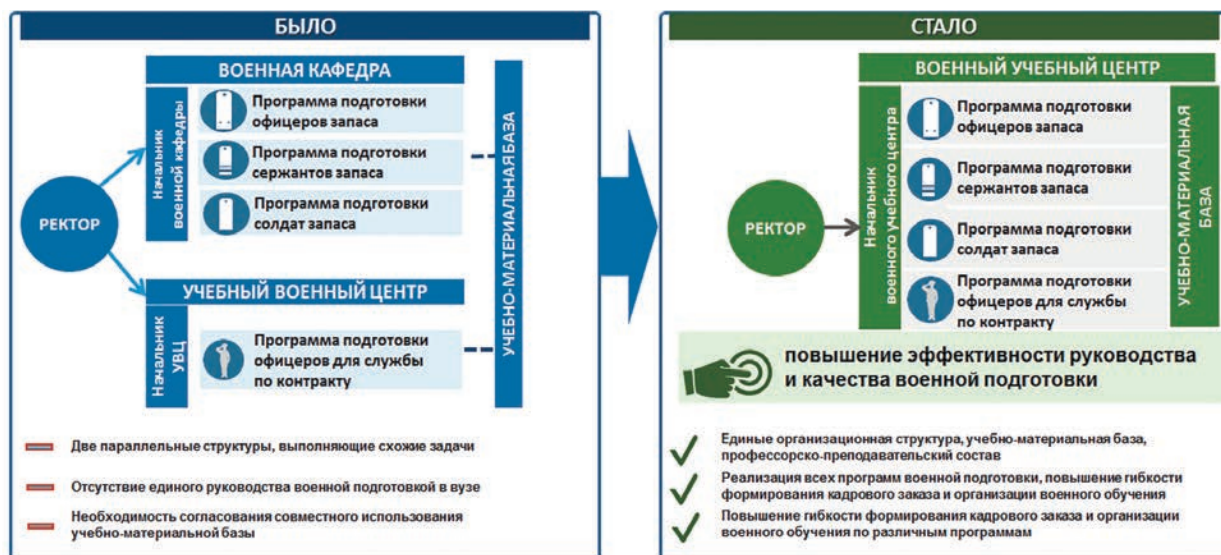
Рис. 5. Создание военных учебных центров

Минобороны России были выработаны предложения по объединению различных структурных подразделений военной подготовки. Указанные предложения были поддержаны Президентом Российской Федерации и на основании его поручения от 16 мая 2017 г. № Пр-950 была организована работа по созданию военных учебных центров (рис. 5).